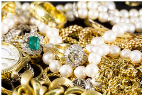
Goldankauf - eine bunte Vielfalt an Objekten!

Wenn von „Goldankauf“ die Rede ist, dann geht es fast ausschließlich um gebrauchte Stücke (= Altgold oder „Bruchgold“, falls die Objekte defekt sind). Diese werden am Ende des Ankaufsprozesses eingeschmolzen (einer Edelmetallscheidung zugeführt) und zu neuen Objekten (zum Beispiel Schmuck, Materialien für Zahnersatz oder zur Industrienutzung) weiterverarbeitet.