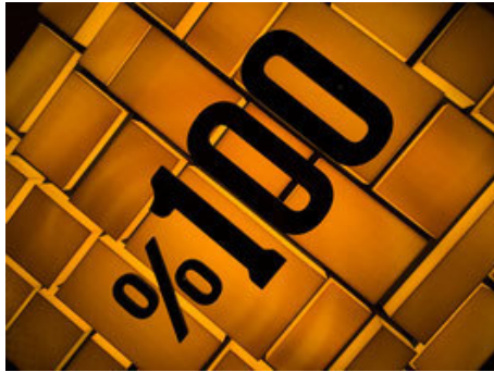
Goldankauf-Tests: 100 % oder gar nichts!