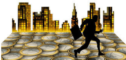
Aufgepasst: Ungereimtheiten beim Goldankauf!

Dieses Kapitel bildet die etwas schwierigeren Themen des Altgoldverkaufs ab.