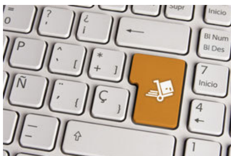
Verschicken leicht gemacht!