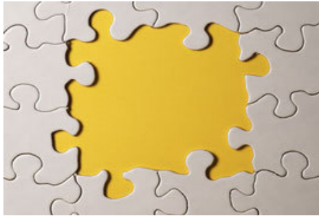
Der Goldankauf - ein offenes Geheimnis!