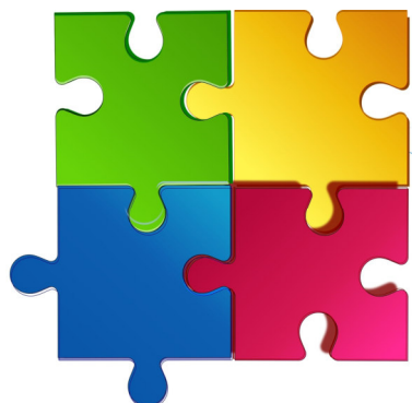
Die vier Varianten der Beratung