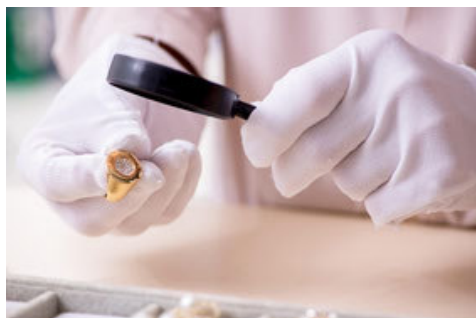
Goldankauf: genaues Hinschauen lohnt!