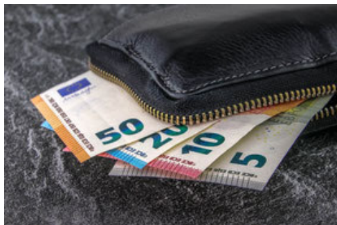
Win-Win: Eine angemessene Vergütung